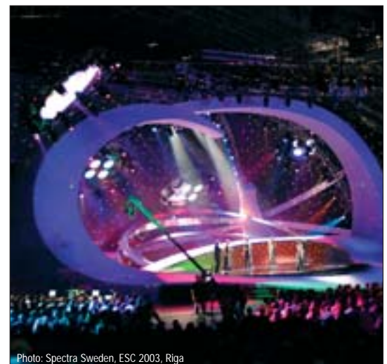
ESC 2003, Riga